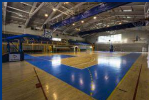
PABELLÓ JOAN ALAY

En todo momento, las gimnastas estarán acompañadas e informadas por los responsables del evento para garantizar el cumplimiento de los horarios y la seguridad.