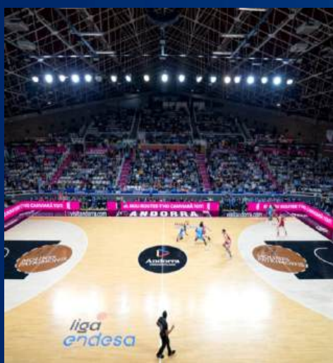
PABELLÓN TONI MARTÍ